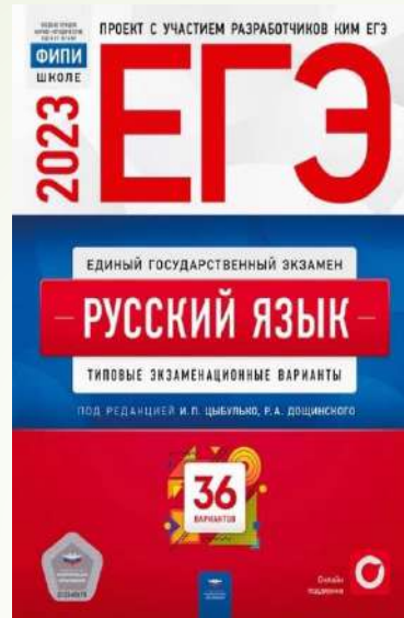
ЕГЭ 2023 Русский язык. И.Цыбулько