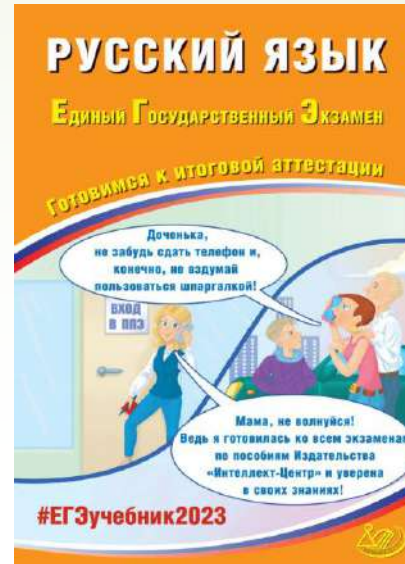
Русский язык. ЕГЭ. Готовимся к итоговой аттестации. С.В. Драбкина, Д.И. Субботин