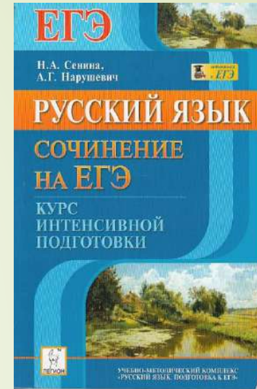
Русский язык. Курс интенсивной подготовки. Сочинение на ЕГЭ. Нарушевич А.Г., Сенина Н.А.