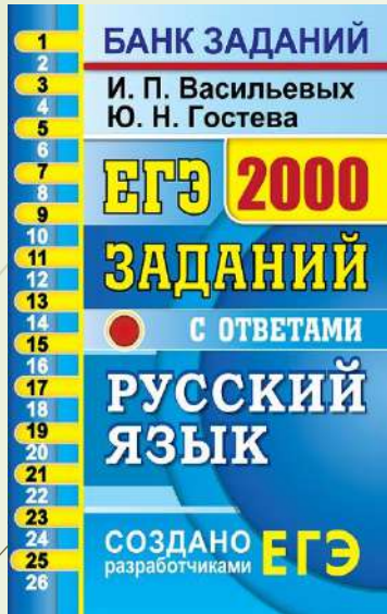
ЕГЭ: 2000 заданий с ответами по русскому языку. И.П. Васильевых, Ю.Н. Гостева