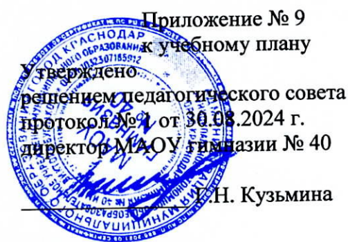
Таблица-сетка часов учебного плана для индивидуального обучения больных детей на дому МАОУ гимназии № 40 на основе ФГОС ООО 2024-2025 учебный год