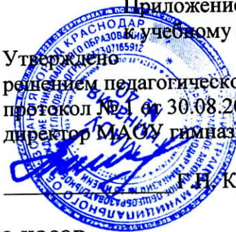
Таблица-сетка часов учебного плана для индивидуального обучения больных детей на дому МАОУ гимназии № 40 на основе ФГОС ООО 2024-2025 учебный год