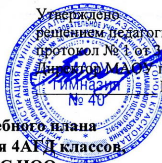
Таблица-сетка часов учебного плана МАОУ гимназии № 40 для 4АГД классов реализующих ФГОС НОО 2024–2025 учебный год

Директор МАОУ гимназии № 40 Ф.Н. Кузьмина