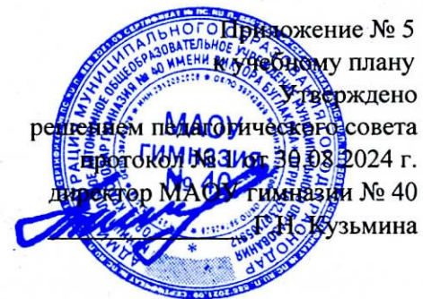
Таблица-сетка часов учебного плана MAOU гимназии № 40 для 3 ГД классов, реализующих ФГОС НОО - 2021 2024 – 2025 учебный год.