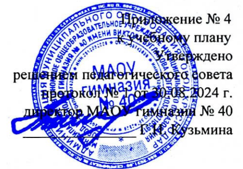
Таблица-сетка часов учебного плана МАОУ гимназии № 40 для 3 АБВ классов, реализующих ФГОС НОО - 2021 2024 – 2025 учебный год.