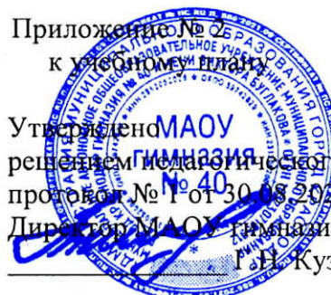
Таблица-сетка часов учебного плана МАОУ гимназии № 40 для 4БВ классов, реализующих ФГОС НОО 2024–2025 учебный год

Утверждено решением педагогического совета протокол № 1 от 30.08.2024 г. Директор МАОУ гимназии № 40 Г.В. Кузьмина