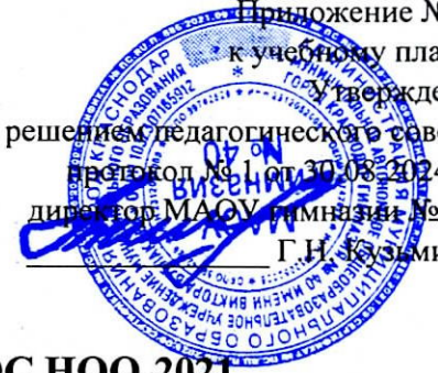
Таблица-сетка часов учебного плана МАОУ гимназии № 40 для 1 - х классов, реализующих ФГОС НОО-2021 2024 – 2025 учебный год.